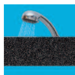
Étanche à l'eau