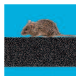
Résistant aux nuisibles