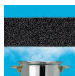
Étanche à la vapeur d'eau